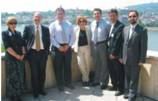
Членовите на делегацијата уживаат во погледот на Дунав

Унгарија претставува интересен пример за скорешна и успешна транзиција од еднопартиски систем во повеќепартиска демократија. Уште од раните 1990ти Национално Собрание на Унгарија стана централна институција на владеење во земјата. Унгарското собрание еволвираше од институција со членови на кои им недостасува политичко искуство и демократски примери во институција со искусни и професионални политичари. Во почетокот, со недостаток на вработени, опрема и ресурси, Националното Собрание сега функционира со обилни човечки и други ресурси за да им се овозможи на пратениците да ги исполнат нивните улоги како законодавци и претставници на народот. Собранието игра критична улога во носењето на закони, има развиено ефективен систем на комисии и активно го спроведува надзорот врз извршната власт.