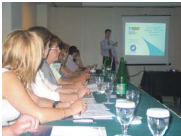
Активистите на Либералната партија на семинар на НДИ во Скопје

Справувајќи се со сликата на најмала пратеничка група во Собранието, активистите на Либералната партија беа првите кои ја започнаа програмата на НДИ за Потенцијални лидери/Развој на локалните ограноци. На 18 јули дваесет активисти од Либералната партија присуствуваа на еднодневна сесија во рамките на програмата со траење од една година, за да истражуваат начини на изградба на нивните вештини и да учат нови техники за зајакнување на локалните ограноци.