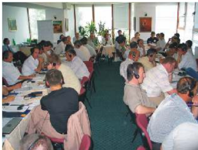
Над 60 активисти на ДУИ присуствуваат на семинар за локалните ограноци во Маврово

Памфлети со краток приказ на главните теми од презентацијата на ДУИ заедно со информација за тоа како да се контактираат пратениците и другите партиски претставници беа широко дистрибуирани на состаноците.