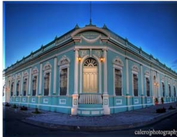
Recuperación del patrimonio