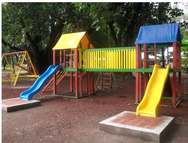
Pequeñas Obras de Gran Impacto