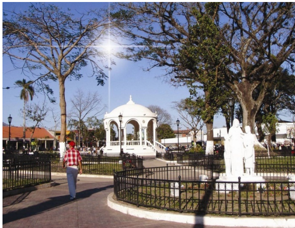
Recuperación de parques