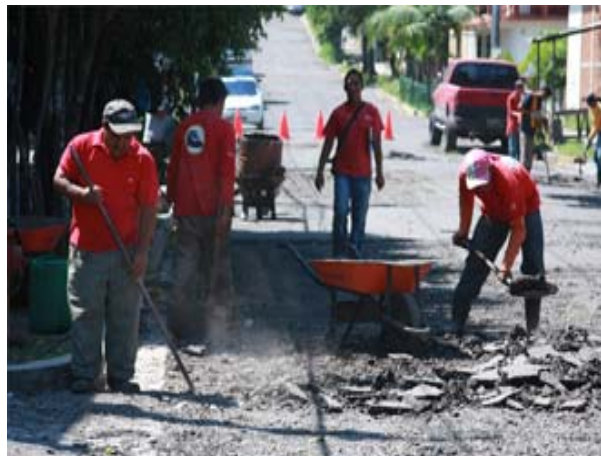
Recuperación de aceras