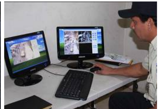
Monitoreo y cámaras de seguridad