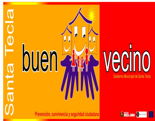
Campaña Buen Vecin@