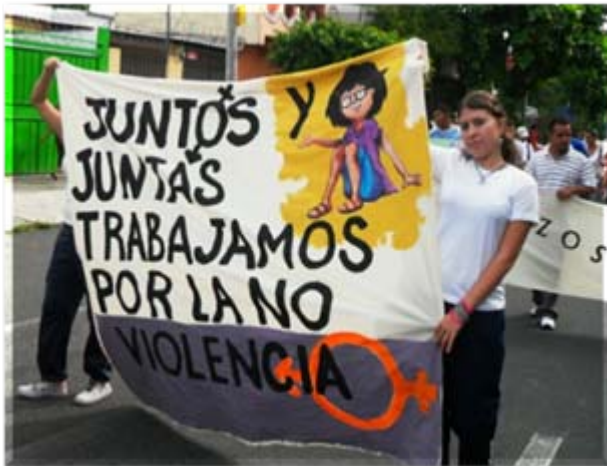
Acciones de protección a la niñez