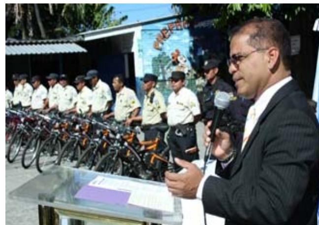
Plan escuelas seguras