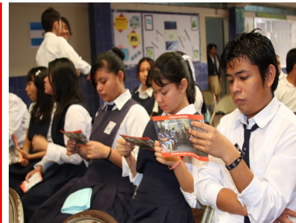
Programas en centros escolares