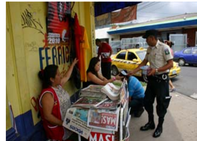
Sensibilización en materia tributaria