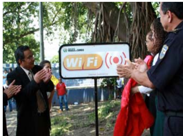
Internet en espacios públicos