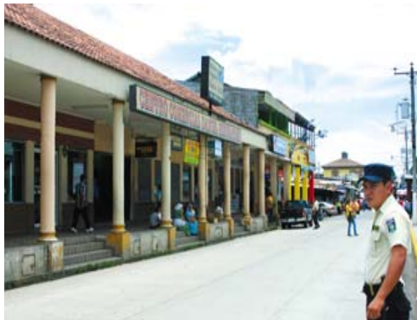
Recuperación de espacios