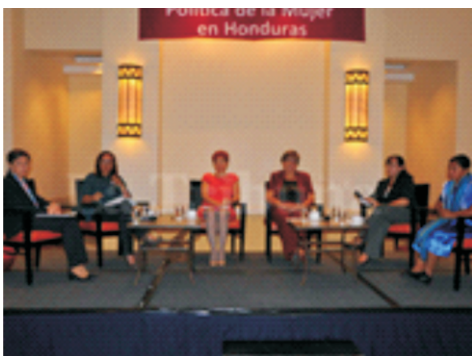
Mujeres políticas participaron en el panel analizando la cuota de poder para ellas.

La plena participación de la mujer en la vida pública es una asignatura pendiente en muchos países y Honduras no es la excepción, a pesar de los avances logrados en los últimos años, concluye el informe presentado por la Fundación Internacional para Sistemas Electorales (IFES), por sus siglas en inglés, y el Instituto Nacional Demócrata para Asuntos Internacionales.