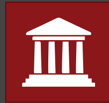
VISITING ASSEMBLY BUILDING