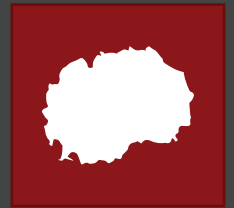
TALK TO PARLIAMENTARIANS