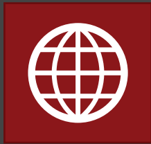
WEBSITE ( https://www.sobranie.mk/ )