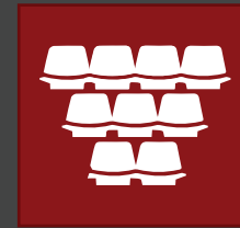
VISITING PLENARY SESSIONS