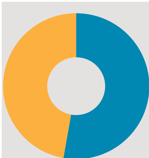
● نەژادى پەرلەمانتار ● نەژادەكانى تر

لە ماوهى خولى ۲۰۱۴ - ۲۰۱۸ى پەرلەمان، هەولئى زۆرى پەرلەمانتار سەباح ئەل تەمىمى لەئىو پەرلەماندا جەختكردنەو بوو لەسەر بەستەنەوى كارى گەيشتنى بە ھاوڵاتييان بە بەرپرسىارىتى چاودىركردنى پەرلەمانى.