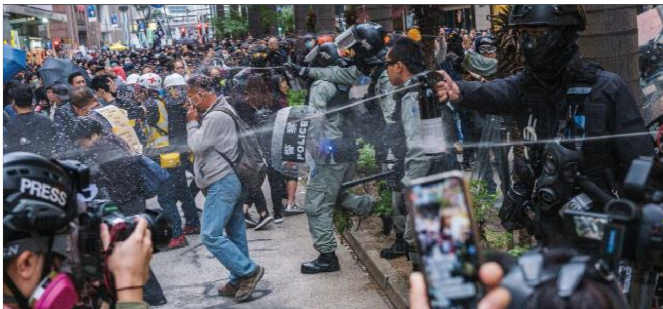
香港警察在一場遊行中以胡椒噴霧噴向手無寸鐵的示威人士和記者。 87

在某些個案中，個別警員被拍到以過度暴力拘捕已被制服的示威人士，把他們頭部壓向行人路上。 88 另外，有警員被拍到以警棍擊向已被制服的示威人士 89 。