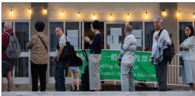
市民在香港沙田排隊參加區議會一般選舉投票。11月24日，413萬登記選民在2019區議會一般選舉中投票。 81

2019年的區議會選舉結果卻表達了一個強烈而明確的訊息。大部分香港人選擇將手中一票交予民主派候選人，民主派在452個議席中取下了392個，成功取得18個區議會中17個的控制權。 79 投票率亦由2015選舉的47%攀升至71%。 80 290萬香港選民以最和平的方式，清楚表達了民主在維持真正自治與法治上的重要性。