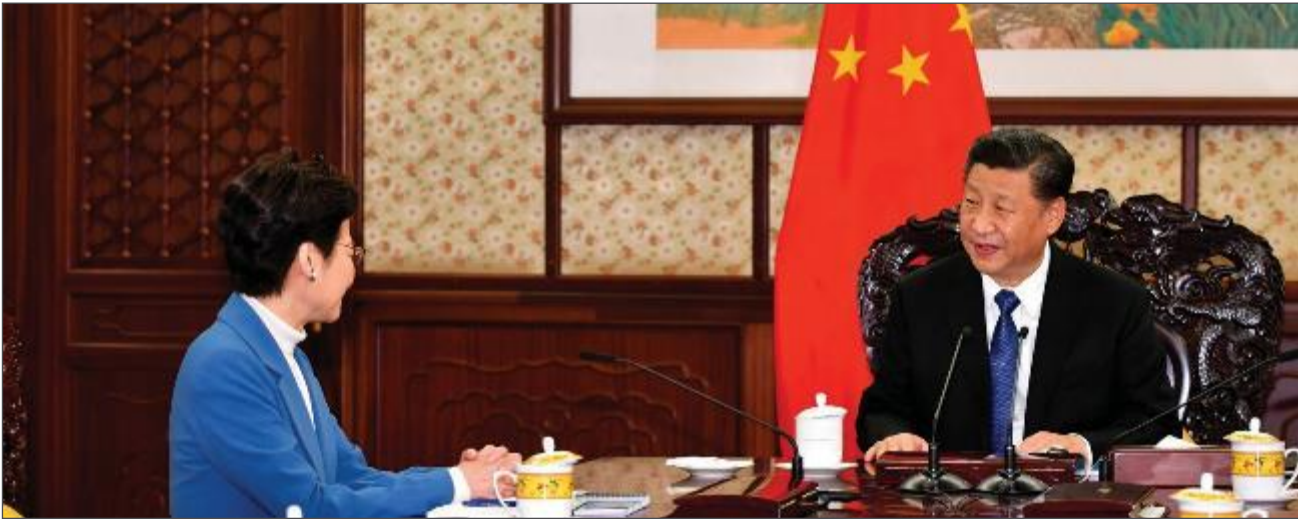
中國國家主席習近平（右）在中國北京會見香港行政長官林鄭月娥（左）。來源未有註明 110

第三，北京鼓勵香港政府採取行動，提高參與示威運動的代價，其中主要通過由警察使用更大武力、提高刑責等脅逼手段達成目的。例如在2019年11月，中國國家主席習近平便發言表示准許使用激進的警力手段作為結束示威的主要工具，並指出當務之急是制止暴力，恢復法治和秩序。 107 他的講話被認為標誌著北京支持以警力制止示威，而這個解決方法依賴的是遏制而非談判。 108 這套策略最近期的例子，是當局在2020年2月拘捕了三名知名運動人物，罪名是他們參與了2019年8月的一場示威活動。 109