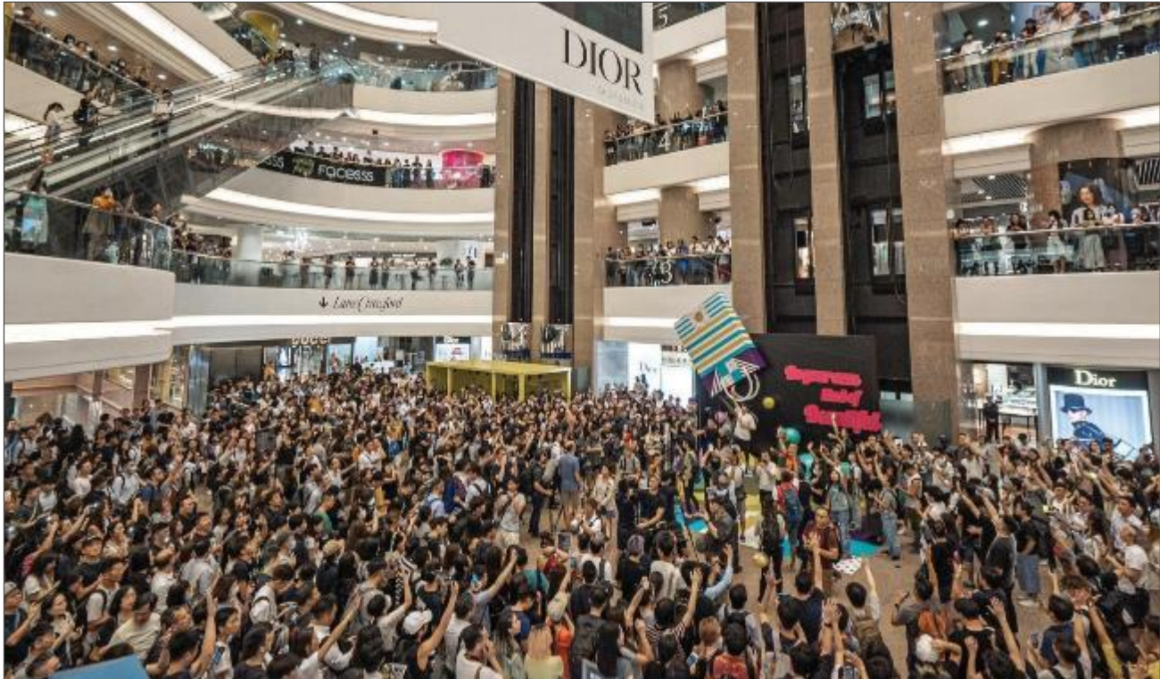
2019年9月12日，香港示威人士在新城市廣場靜坐期間高唱《願榮光歸香港》。 113

一些示威組織者提出，民主示威人士的暴力行為主要是回應警察的激進行動。換言之，若警方能保持克制，示威人士大都會避免使用暴力。有關理論在2019年12月8日得到證實，當時約80萬示威人士走上香港島的街頭，參與自8月中以來首次獲得批准的示威活動。當日警察在使用武力方面相對克制，示威人士亦大致保持和平；這最少提供了一些證據，說明示威人士通常都是在被動情況下使用暴力，並非有意為之。