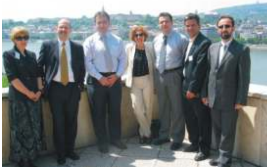
Anëtarët e delegacionit të fascinuar nga pamja e Danubit

H ungaria ofron një shembull interesant të një tranzicioni të suksesshëm të kohëve të fundit prej sistemit një partiak në demokraci shumë partiake. Qysh prej fillimit të viteve të '90-ta Kuvendi kombëtar hungarez është shndëruar në institucion qendror në qeverisjen e vendit. Parlamenti hungarez ka evoluar prej një institucioni me anëtarë që nuk kanë pasur përvojë politike dhe model të funksionimit demokratik, në një institucion me politikanë profesional dhe me përvojë. Fillimisht me mungesë të personelit punues, teknikës dhe mjeteve, Kuvendi kombëtar tash funksionon me njerëz dhe mjete të mjaftueshme për të mundësuar deputetët të përmbushin rolin e tyre si ligjvënës dhe përfaqësues të popullit. Parlamenti luan rol të rëndësishëm në nxjerrjen e ligjeve, ka të zhvilluar një sistem efektiv të komisioneve dhe vazhdimisht zbaton kontrollë mbi qeverinë.