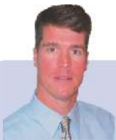
Shkruan: David Dougherty Drejtor i programit për parti politike